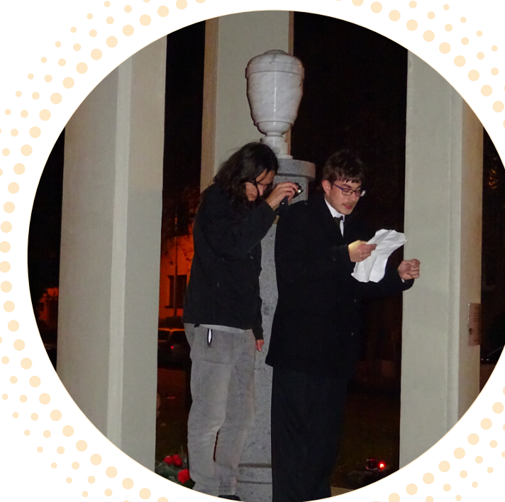
MĚSTSKÁ HRA "1989"