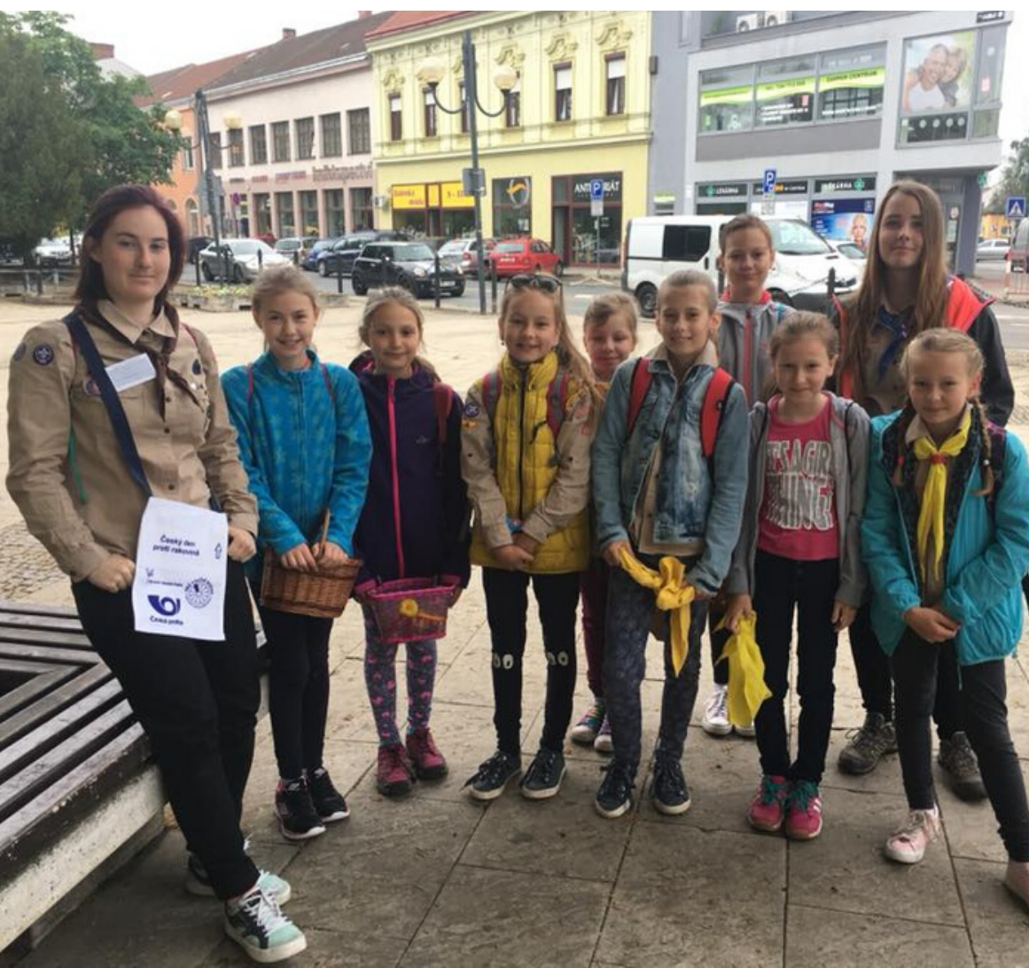
ČESKÝ DEN PROTI RAKOVINĚ