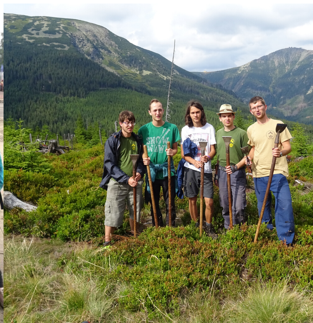
POMOC PROTI KŮROVCI V KRKONOŠÍCH