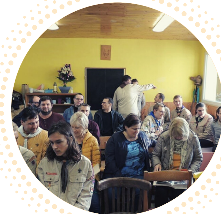
BESEDA S PAMĚTNÍKY

Skauti a skautky z Břeclavi se v roce 2019 přidali k oslavám 30 let svobody v České republice a pro obyvatele města i sebe připravili několik vzpomínkových a pietních aktivit. V parku u pěší zóny kousek u kašny narazili kolemjdoucí na skautský Strom svobody. Byl ověšený klíči, které postupně přibývaly. Právě svazky klíčů, které ve větru o sebe cinkají, byly připomínkou tehdejšího symbolu revoluce, kdy lidé na náměstích po celé republice společně zvonili klíči za svobodu a demokracii. Připojit svůj klíč mohl kdokoliv a v den výročí byl strom skutečně ověšen desítkami klíčů.