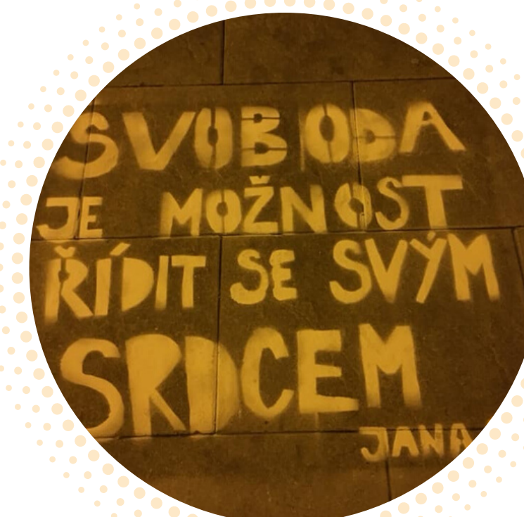
CO TO JE SVOBODA?

které jsme umístili na sociální síť střediska i oddílů. Odpovědi vybraných skautek a skautů jsme během schůzek dětí natočili a sestříhali v krátké video, abychom si jedinečné odpovědi uchovali. Názory dětí i dospělých se tak šířily i mimo město. Video si zobrazilo více než 4 tisícům uživatelů a téměř 2 tisíce uživatelů si video pustilo. Video je stále dostupné na facebookové stránce břeclavského střediska.