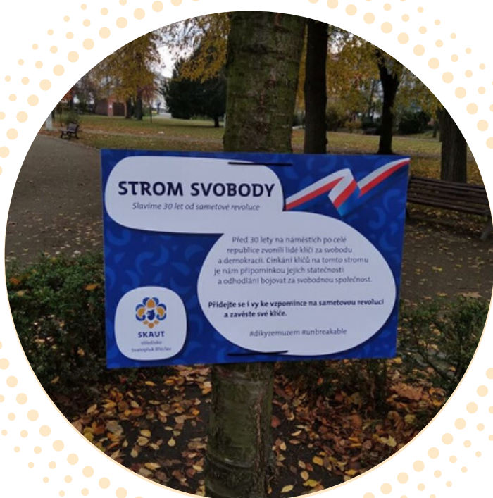
KLÍČEMI OVĚŠENÝ STROM

V rámci oslav jsme si také položili otázku, co je pro nás svoboda. Pro někoho znamená možnost volně cestovat, pro jiného rozhodovat se svým srdcem nebo mít práva a povinnosti, která nám neubližují. Na odpovědi skautských dětí různého věku i dospělých narazili lidé na pěší zóně mezi nádražím a gymnáziem a také u kostela na náměstí T. G. Masaryka. Desítky citátů o svobodě byly dočasně namalované na chodnicích a kolemjdoucí se u nich s radostí zastavovali a četli si je. Trvale jsme citáty namalovali na přístupovou cestu ke skautské klubovně v Šilingrově ulici. Současně jsme natočili video,